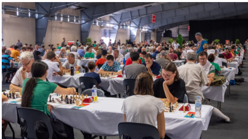
Le Parc des Expositions d'Albi lors des Championnats de France toutes catégories 2022

Le Parc des Expositions d'Albi sera le cœur battant du France Jeunes Crédit Mutuel !